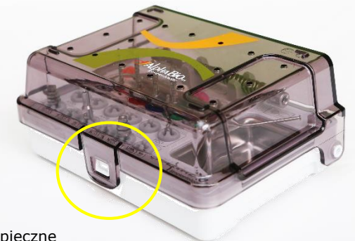
Bezpieczne zamknięcie kasy