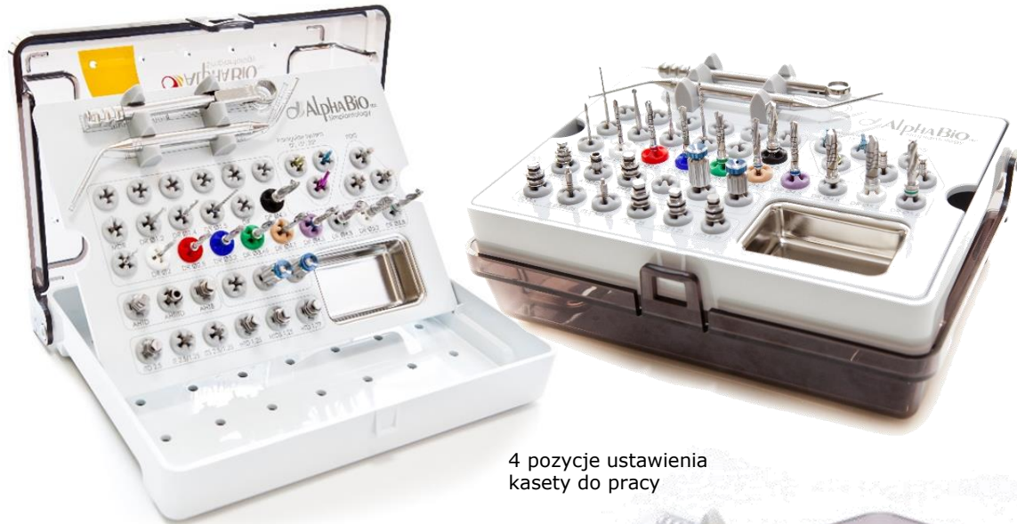
4 pozycje ustawienia kasy do pracy

Kaseta chirurgiczna zawiera wyposażenie niezbędne do przeprowadzenia procedur chirurgicznych.