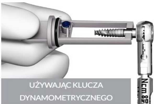
UŻYWAJĄC KLUCZA DYNAMOMETRYCZNEGO