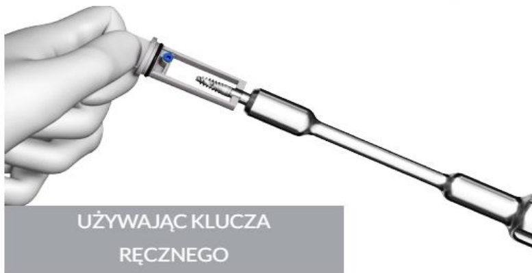
UŻYWAJĄC KLUCZA RĘCZNEGO